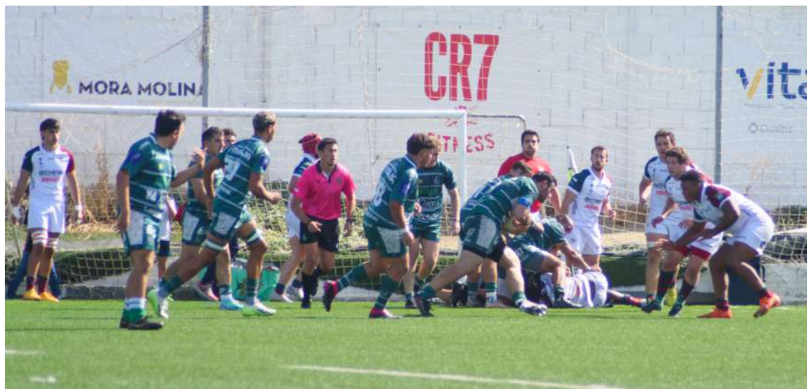
Una fase del juego Jaén Rugby vs CAR Sevilla

te para los verdeoliva. Poco a poco su juego y su físico se iban imponiendo. Juan Castro sumaba metros ganados, La delantera -Ojeda, Santías, Díaz, Ocaña, Gabana- percutía escoltada por sus jóvenes flankers - "Reche" y "Manan"-, un juego coral, sí, pero que tiene nombre y tiene apellidos. En una de esas incursiones en campo contrario, los jiennenses provocaron un fuera de juego. Nuevo golpe de castigo, este a unos 40 metros de distancia de los palos, y otros tres puntos más (9-3). Quizás otra de las virtudes que llevó al equipo jiennense a la victoria fue no dar el partido nunca por ganado. Los jugadores creían en la victoria, pero quedaban por delante