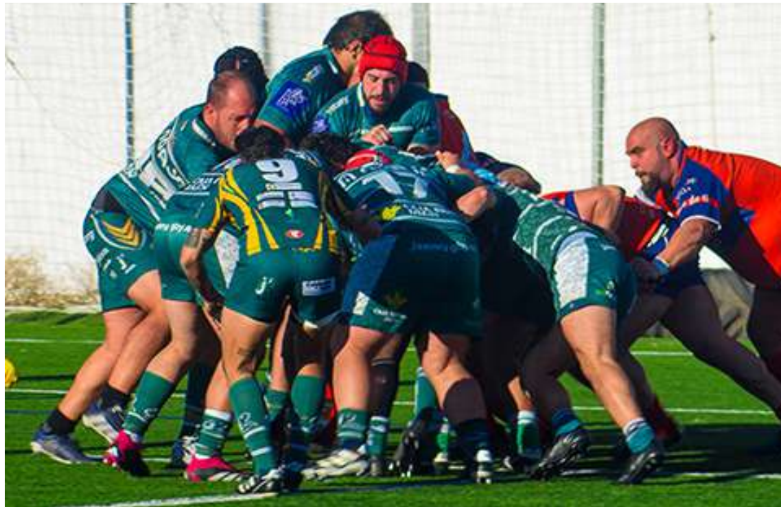
Jaén Rugby Senior Masculino

Los siguientes minutos fueron los más intensos de la primera parte. En el 26, Álvaro Suso se desenganchó de un maul formado tras un buen saque lateral y consiguió el tercer ensayo para Jaén Rugby (21-5). En la jugada siguiente, Universidad de Granada les devolvía el golpe con un ensayo similar (21-10). La guinda la pondría Juanmi Sánchez en el minuto 33