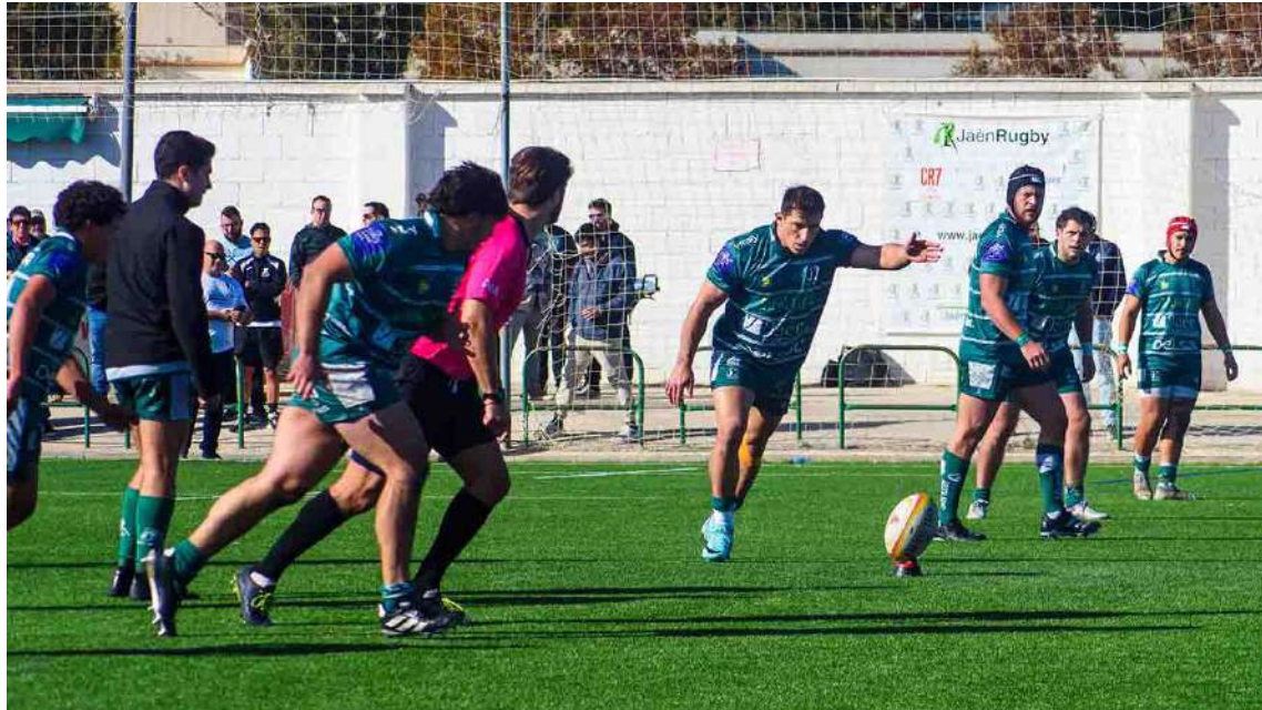
Jaén Rugby Senior DHB

Empezar el año con una victoria. Ese era el objetivo y Jaén Rugby lo ha logrado en un partido jugado al límite contra AD Arquitectura. Al límite de las fuerzas, al límite de las pulsaciones que resiste un corazón sano y, por qué no decirlo, al límite del reglamento. No es una crítica, el partido lo exigía, sobre todo viendo el marcador. Al final, la fe y la confianza en su sistema de juego le concedió la victoria por un solo punto a Jaén Rugby: 32-31. Un segundo antes del pitido final, el marcador reflejaba otro marcador, un 28-31 a favor de AD Arquitectura. Créanme. No se trata de atraer público al Campo de Rugby de Las Lagunillas. Pero partidos como el de este domingo convalidan muchas sesiones de coaching. Ha sido un partido intenso, nervioso. Tanto que a los cinco minutos ya se habían disputado tres melés. La delantera jiennense se vio superior en esas fases estáticas y castigó con ellas a los colegiales madrileños. Así subieron los primeros puntos al marcador, con un ensayo de castigo a favor de Jaén Rugby (7-0). El partido se ponía de cara para el equipo local y la grada respondía, consciente de la importancia de los puntos en juego. AD Arquitectura se sacudió esa presión inicial gracias a la calidad individual de su apertura que anotaba y hacía anotar a sus compañeros. Tres chispazos, tres ensayos transfor-