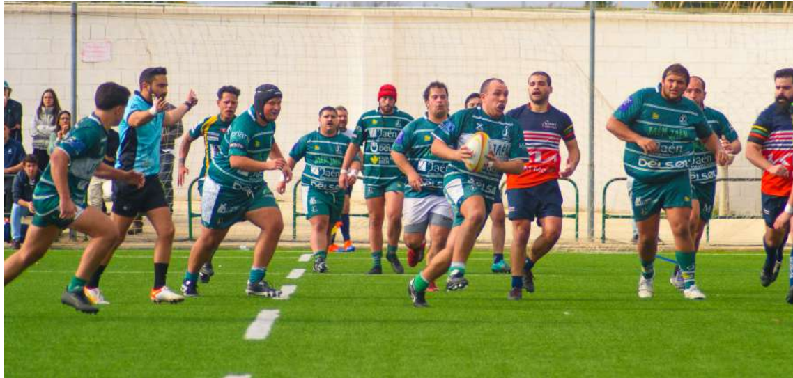
Jaén Rugby Senior/ Fotos: Concha Gómez.

Los jiennenses mantuvieron la iniciativa después de recibir el saque de centro y castigaron la defensa rival una y otra vez. Dos fallos de manos y dos placajes in extremis impidieron que los locales ampliaran su ventaja. El ensayo llegó en el minuto 33: golpe a cinco metros de la línea de ensayo que Jaén saca