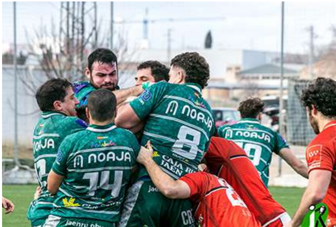
Jaén Rugby Senior DHB/ Fotos: Archivo de Jaén Rugby.

Jaén Rugby también había enseñado sus cartas. Fuertes en melé y duros en los placajes. El saque de centro posterior al ensayo encajado le concedió la iniciativa los jiennenses. Les bastaron dos fases y ganar un saque de touch para que Luis Alberto Enrique rompiera la defensa por potencia y habilidad con una carrera de más de 30 metros. Javier